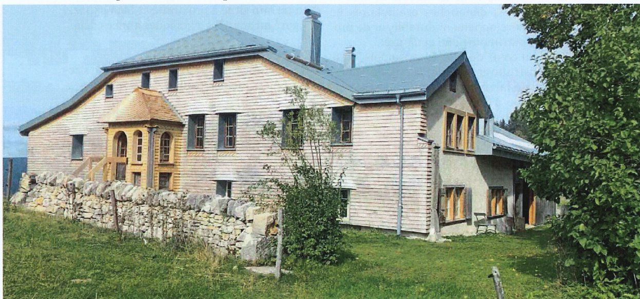
La ferme horlogère des Mollards-des-Aubert, est située à quelque 1300 m d'altitude, au nord de la route reliant Le Brassus au Marchairuz. La Fondation est présidée par Jean-Luc Piguet, auteur de la photo ci-dessus.

Infos sur la Fondation et la restauration: https://les-mollards-des-aubert.ch